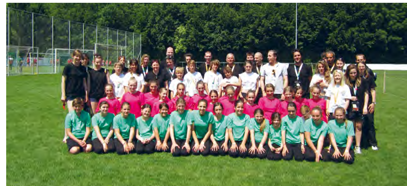
Une forte délégation de gymnastes de Bourg-en-Lavaux.

Les 15 et 16 juin dernier, la Fédération Suisse de Gymnastique de Cully a rejoint les 17000 jeunes qui ont participé à la fête fédérale de gym. Organisée tous les 6 ans, cette grande aventure avait lieu à Bienne.