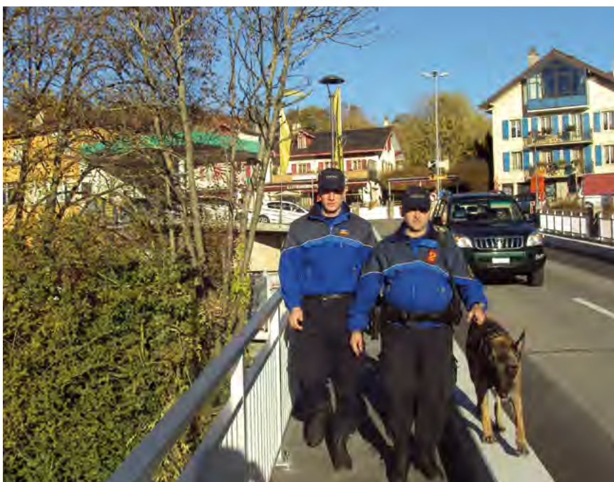
«Protéger et servir», devise de l'APOL.

En septembre 2009, le choix du peuple s'est porté sur une police de proximité, basée sur la coexistence entre police régionale et cantonale. Depuis janvier 2012, l'APOL (Association Police Lavaux) a ainsi repris le contrat de la prévention, de l'administration et de la répression dans notre région. Cette nouvelle organisation n'a pas été choisie au hasard : elle permet une meilleure sécurité, en privilégiant une coordination et une cohérence dans l'intervention policière.