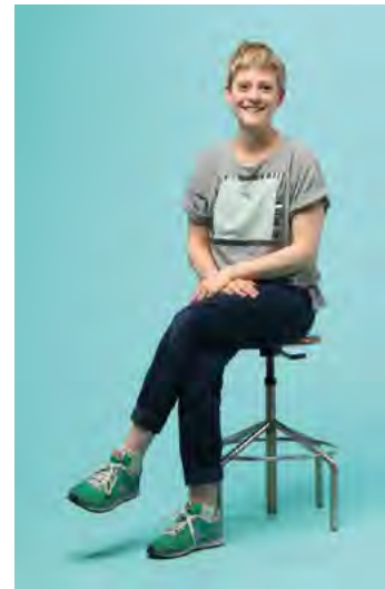
Une styliste haut de gamme.

Deux prix prestigieux : le prix Chloé et le prix du Suisse Design Award. Cela dit déjà beaucoup du talent de cette jeune styliste de 24 ans. La passion commence sur les bancs de l'école communale : le cours de couture est celui qu'elle préfère et qui lui fait attendre le suivant avec impatience. Un stage auprès de Nadia Cuénoud et un bachelors à l'HEAD à Genève plus tard, elle ira se froter à la mode à Londres, New York et Amsterdam. Mais ne vous