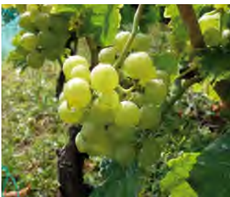
Vins, vignes et vigneron (pages 2 et 3)