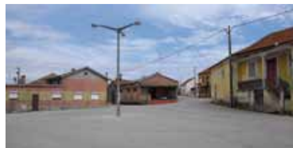
... à Pedralva.

Nous avons terminé notre formation de cinéastes en 2010 à la Haute école d'art et de design de Genève. Plusieurs de nos films ont été sélectionnés dans divers festivals suisses et internationaux. Actuellement, nous travaillons sur un nouveau projet documentaire incluant Grandvaux.