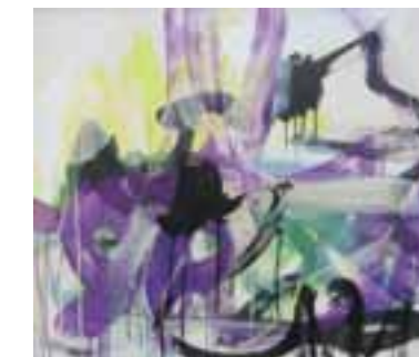
Image: sans titre - composition 2012 n° 14 - technique mixte 77 x 87

Un voyage pictural à goûter sans modération! Michel Reymondin - expert en œuvres d'art.