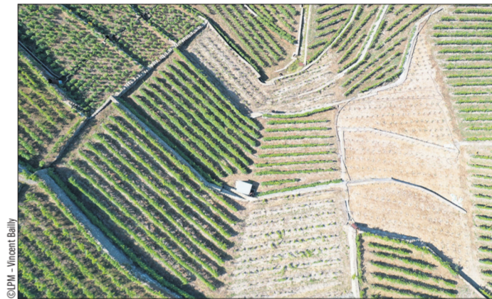
Les murs de Lavaux vus du ciel

7 et 8 septembre : 9h40, 10h40, 11h40, 13h40, 14h40, 15h40 Inscriptions dès le 26 août sur www.lavaux-unesco.ch