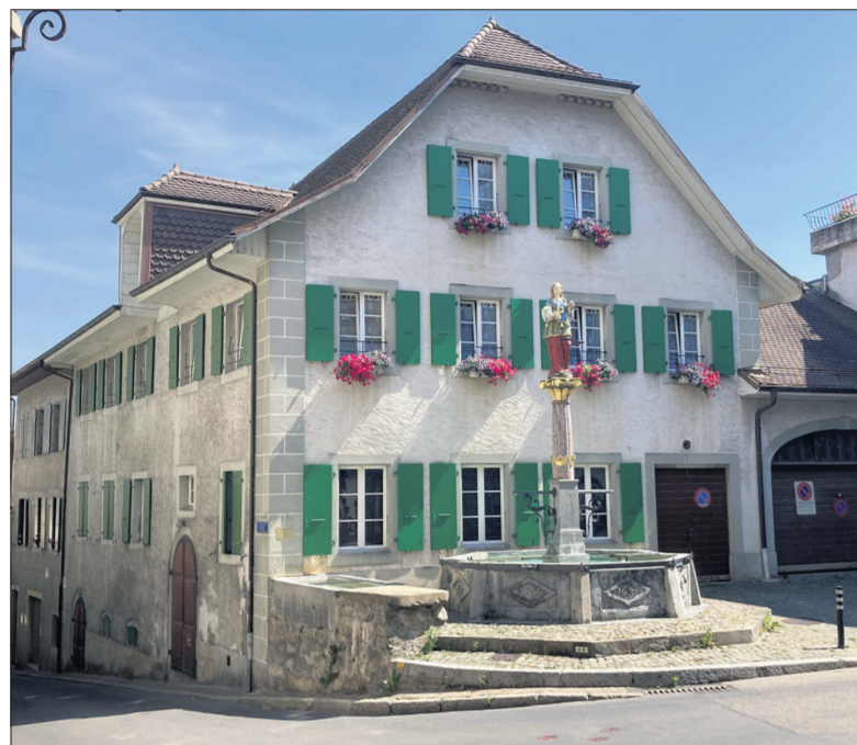
Le bâtiment de la rue du Temple 1 à Cully, avant le début des travaux

L'installation de vie et le stationnement des véhicules liés du chantier seront localisés sur la place d'Armes. En ce qui concerne l'accès au chantier, la circulation sera canalisée par l'est du bourg afin de ne pas charger la rue de la Gare fortement perturbée par la mise en place des conduites du chauffage à distance et par le renouvellement des conduites d'eau.