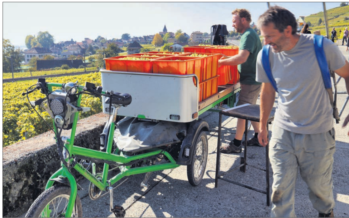
Une journée de vendanges entièrement ramenée à la cave à vélo (électrique). Ludique, écologique et rapide, ce vélo-cargo attire tous les regards des promeneurs!