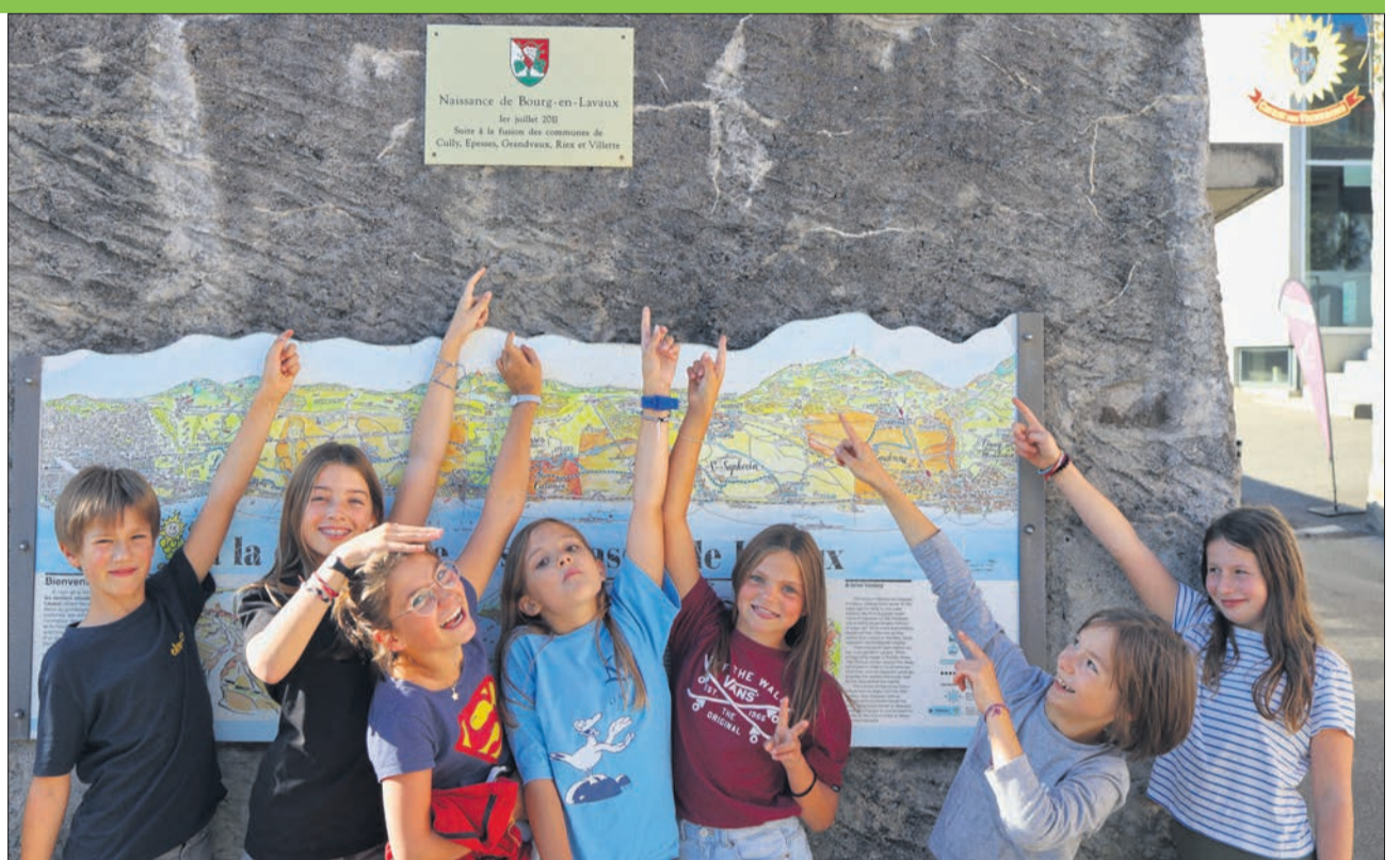
Les jeunes nés en 2011 devant la plaque commémorative marquant la naissance de Bourg-en-Lavaux

Jean-Christophe Schwaab, municipal en charge des infrastructures et de la mobilité, se souvient: «Les cinq syndics de l'époque étaient très visionnaires. Les communes avaient déjà regroupé plusieurs services comme celui des pompiers, des écoles, des eaux usées, entre autres. Fusionner était la suite logique, mais la tâche était loin d'être facile car les cinq villages ont toujours eu des