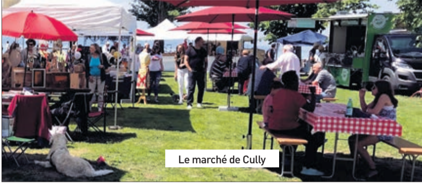
Le marché de Cully

Toute l'année sur la place du Temple à Cully: le jeudi matin de 8h à 12h, vous trouverez le marché hebdomadaire avec des marchands qui se complètent pour offrir un choix varié de produits frais.