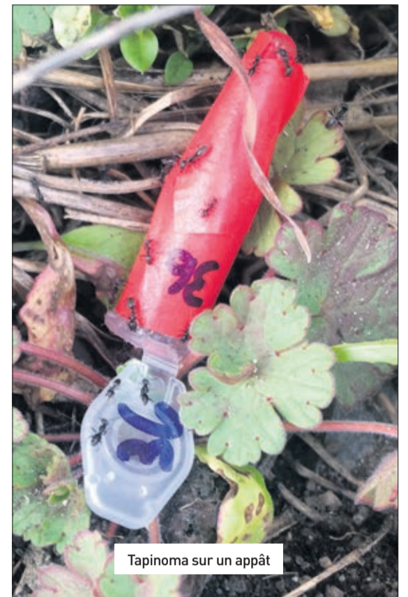
Tapinoma sur un appât