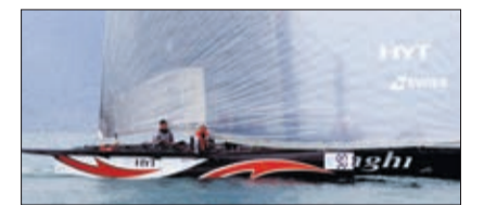
Alinghi, 2 e en 2016 et vainqueur l'an dernier

Introduit en 2016, Aper Ô lac permet d'assister au Bol d'Or depuis les quais. A cette occasion, le Caveau ouvre exceptionnellement samedi dès 11