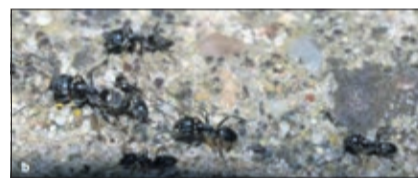
Tapinoma magnum : (a) grandes ouvrières de 3,5 à 4 mm (b) petites ouvrières de 2 à 2,5 mm