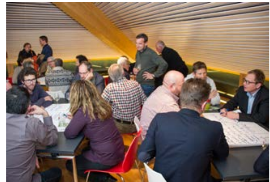
Atelier participatif durant une séance BEL Action.

Votez pour nous pour que nous puissions réaliser ces projets !